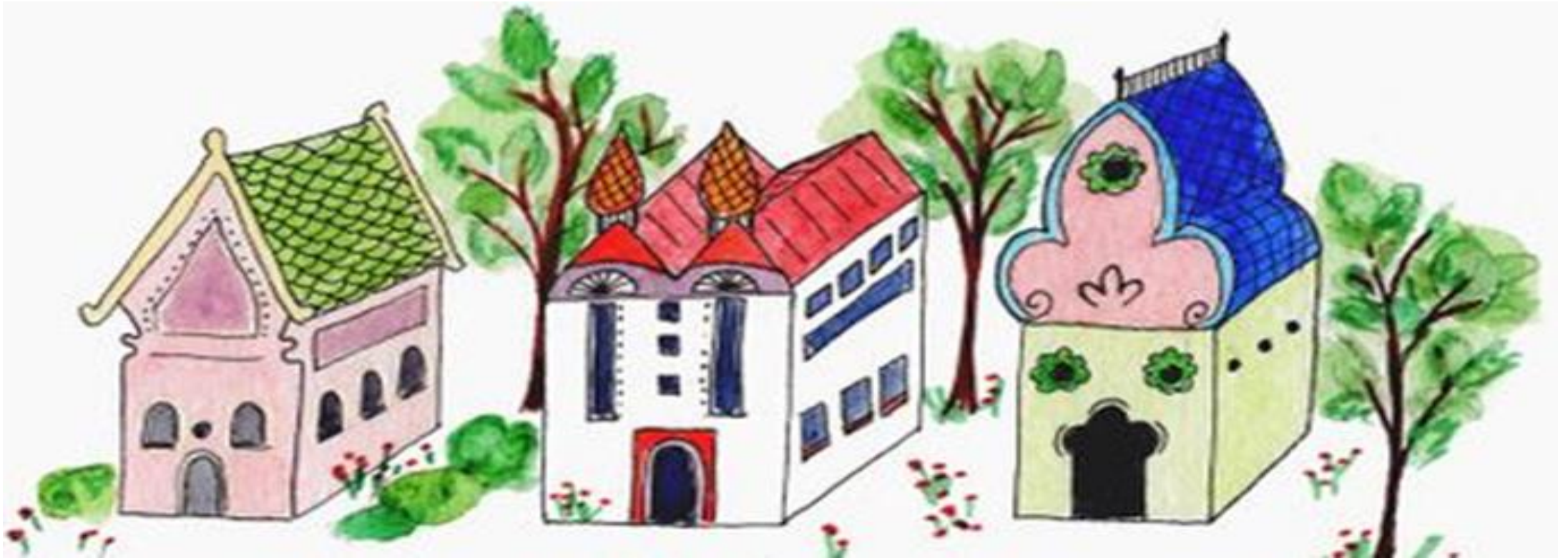
Hyvien asioiden talo